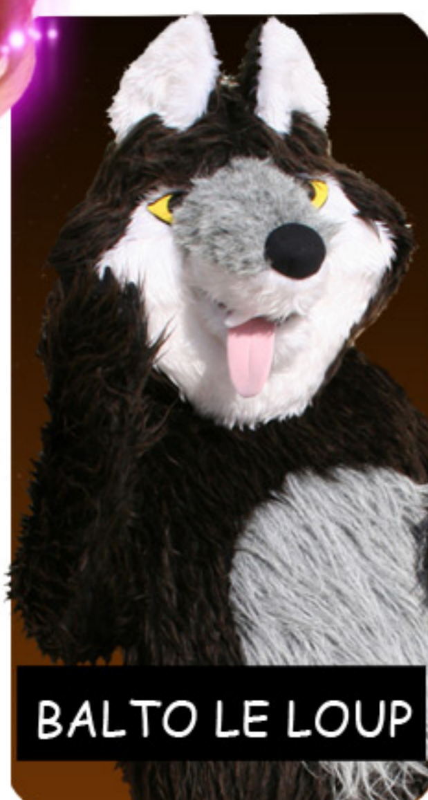
BALTO LE LOUP